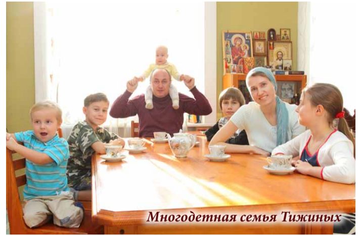
Многодетная семья Тижиных